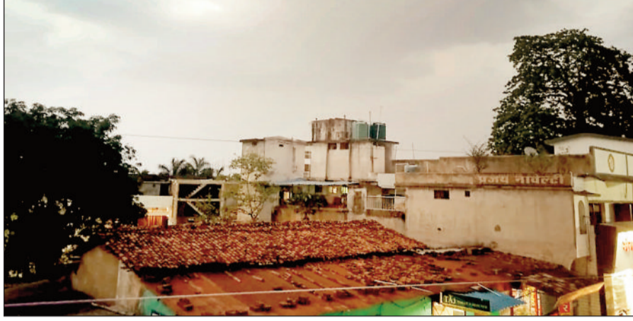
हरिभूमि न्यूज || बैकुण्ठपुर

कोरिया जिले में बीते कुछ दिनों से मौसम का सिस्टम बिगड़ने के कारण मौसम का मिजाज बदल गया है। दिन में धूप छांव की स्थिति बनते रहते हैं, इसके चलते अधिकतम तापमान में गिरावट दर्ज की गई।