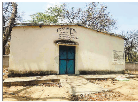
बंद उप स्वास्थ्य केन्द्र।