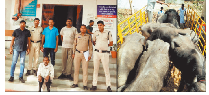
बैकुण्ठपुर